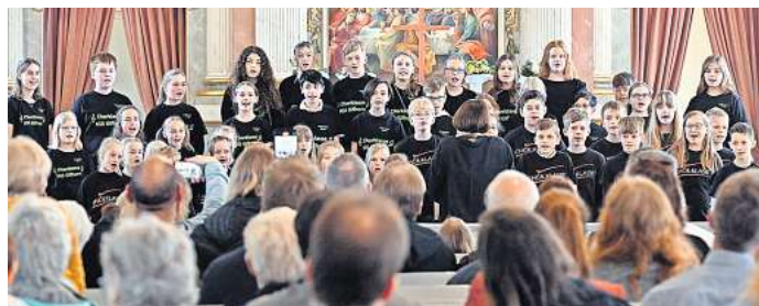
Sangesfreudiger Nachwuchs: Chorklassen der Grundschule Wasbüttel und der IGS Gifhorn gestalteten zusammen ein Konzert in der St. Nicolaikirche.