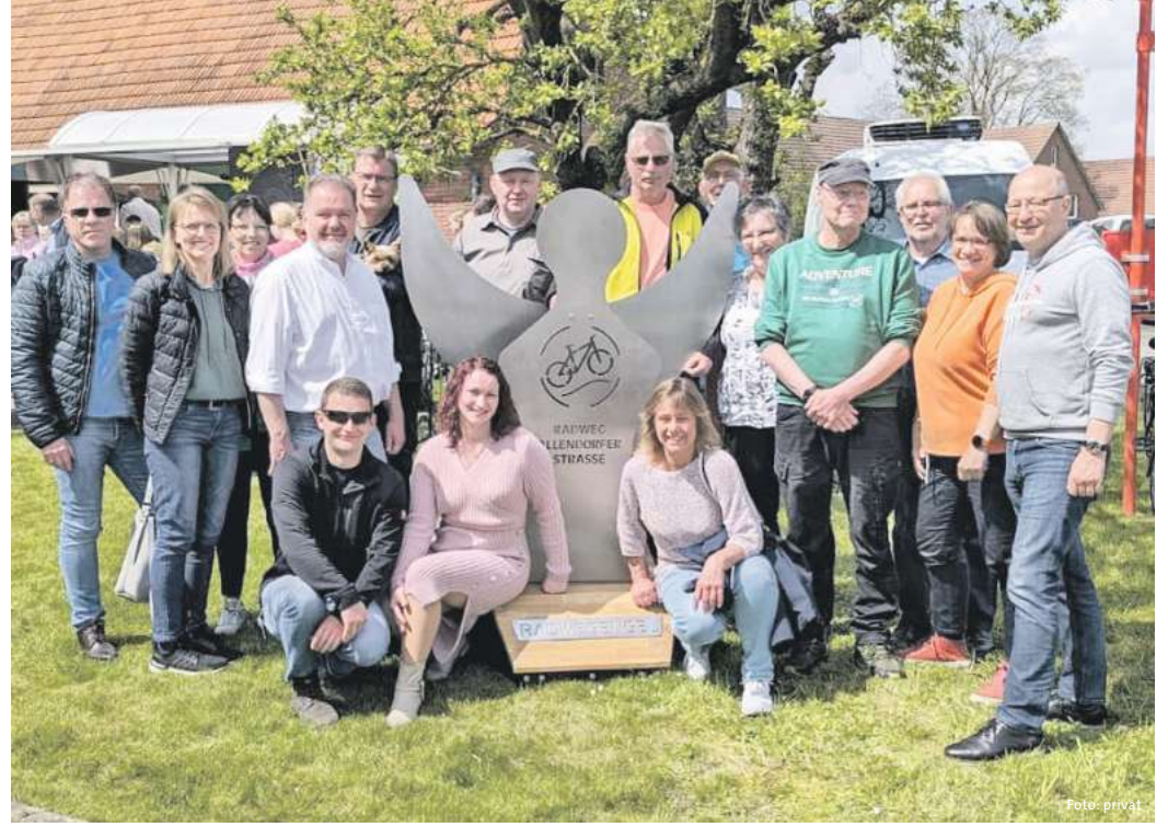
Mitglieder des Vereins und der Verwaltung der Samtgemeinde tauschten sich mit dem Verein Radweg Allendorfer Straße in der Gemeinde Hilter aus.

Synergien schaffen und Erfahrungswerte austauschen: Mitglieder des Vereins und der Verwaltung der Samtgemeinde Meinersen machten sich vor Kurzem auf den Weg in die Gemeinde Hilter am Teutoburger Wald. Dort wurde der erste Teilabschnitt des ersten Bür-