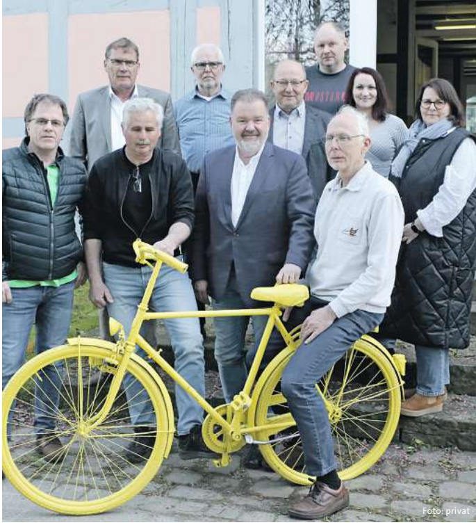
Die Vereinsmitglieder übernehmen die Planungen für den Radweg Leiferde–Ettenbüttel.