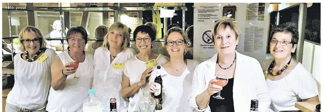
Das Thekenteam der LandFrauen verwöhnte die Gäste bei der Midsummernacht.