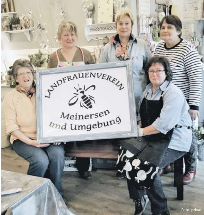
Ein Vintage-Workshop in Leiferde begeisterte die LandFrauen.