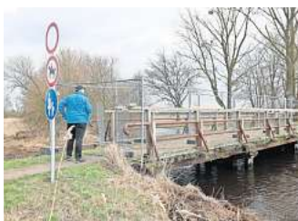
Marode Isebrücke: Die Stadt geht in diesem Jahr den Neubau an.