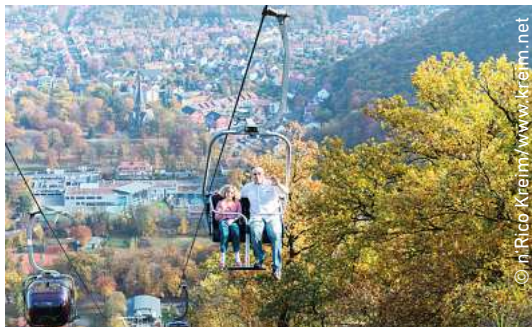
SCHWEBEN WIE EIN FALKE: Mit den Seilbahnen Thale kann man wie ein Falke übers Bodetal gleiten.