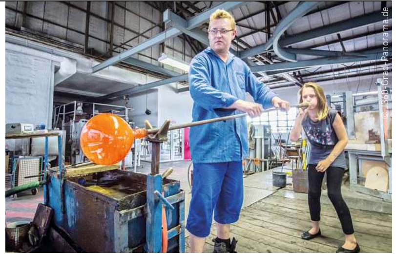
GLASERLEBNISWELT: Wissenswertes zum Thema Glas erfahren – bei einem Erlebnisrundgang durch die Manufaktur.

■ Glasmanufaktur Harzkristall Im Freien Felde 5 38895 Derenburg www.harzkristall.de