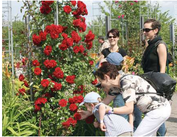
EUROPA-ROSARIUM: Der Park ist zu jeder Jahreszeit eine wahre Entdeckung.