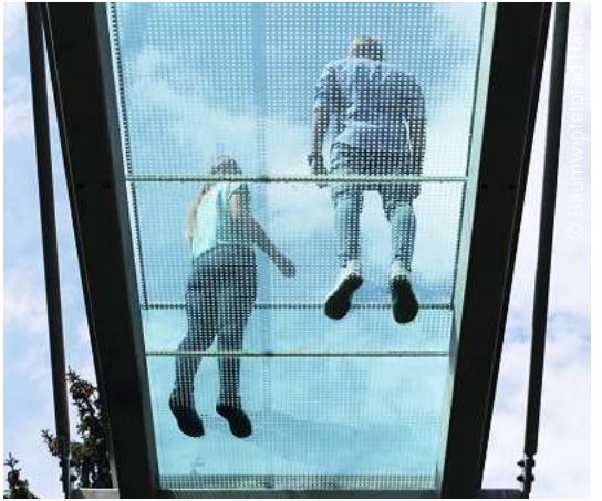
GLASSTEG: Von hier bietet sich eine gute Aussicht auf den Harz.