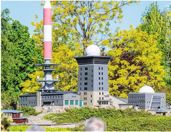
„KLEINER HARZ“: Mehr als 60 kulturhistorisch interessante Sehenswürdigkeiten des Harzes gibt es zu bewundern.