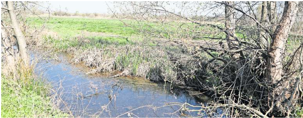
Der Drömling ist Unesco-Biosphärenreservat.

Laut einer von der Naturschutz-AG des Heimatvereins Vorsfelde durchgeführten Meinungsumfrage werde die geplante Wohnbebauung „Östlich an der Meine“ kritisch bis ablehnend gesehen, heißt es. Vielmehr würden viele Menschen den Alternativ-Entwurf des Nabu Wolfsburg begrüßen, hier eine Grünzone mit Aufenthaltsqualität für Menschen und Lebensraum für Pflanzen und Tiere zu schaffen. Das künftige Eingangstor zum Biosphärenreservat