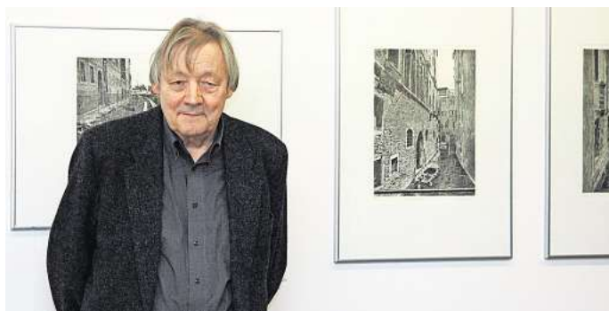
Malte Sartorius in der Ausstellung zu seinem 75. Geburtstag in der Städtischen Galerie. Sein „Venedig“ zeigte unbekannte Seiten der Touristenmetropole.

Bis die Arbeiten des 1933 in Ostpreußen geborenen Künstlers in Wolfsburg zu sehen sind, wird noch ein wenig Zeit vergehen. „Es ist geplant, eine kleine Werkpräsentation im Südflügel