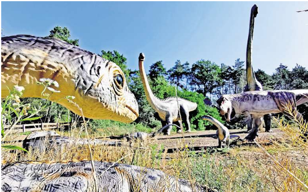
Auch für den Dinopark Münchshagen gibt es Eintrittskarten zu gewinnen: Lebensgroße Rekonstruktionen von Dinosauriern und anderen Urzeittieren sind dort zu sehen.

Mit dabei ist zum Beispiel ein Familienticket für das Wisentgehege in Springe. Eintrittskarten für insgesamt zwölf Ausflugsziele gibt es zu gewinnen, jeden Tag für ein anderes. Natürlich wird vorher nicht verraten, an welchem Tag welches Ticket verlost wird, sodass immer ein Überraschungsmoment dabei ist. Mal geht es nach Bad Harzburg zum Baumwipfelpfad, mal nach Hannover zu den PS Days. Der Dinopark in Münchshagen ist ebenso ein Ziel wie der Ersepark in Uetze. Auch der Weltvogelpark in