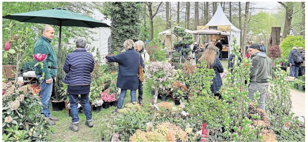
Eine beinahe unbegrenzte Auswahl an Pflanzen, Garten- und Wohnaccessoires, Kunstobjekten, Kräutern und vielem mehr erwartet die Besucher bei „Gourmet & Garden“.

Zehn WAZ-Leser können gemeinsam mit einer Begleitperson kostenlos über das Gelände schlendern, denn die Wolfsburger Allgemeine Zeitung verlost