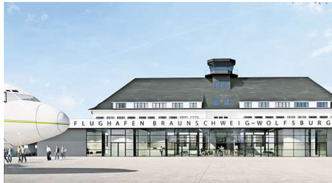
Das neue Terminal wird vor dem denkmalgeschützten Hauptgebäude gebaut.

„Durch das neue Terminal wird der Flughafen sowohl technisch als auch im Hinblick auf die Kundenorientierung erheblich aufgewertet. So können die Anforderungen des Clusters am