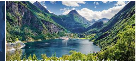
Geirangerfjord, © Andrew Mayovsky - stock.adobe.com