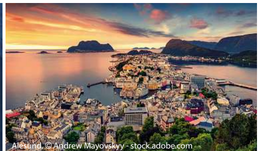
Ålesund, © Andrew Mayovsky - stock.adobe.com