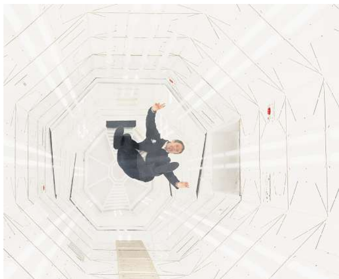
Kunstmuseum Wolfsburg: Rund um die aktuelle Ausstellung „Leandro Erlich. Schwerelos“ bietet das Museum im Oktober und November jede Menge spannende Veranstaltungen an.