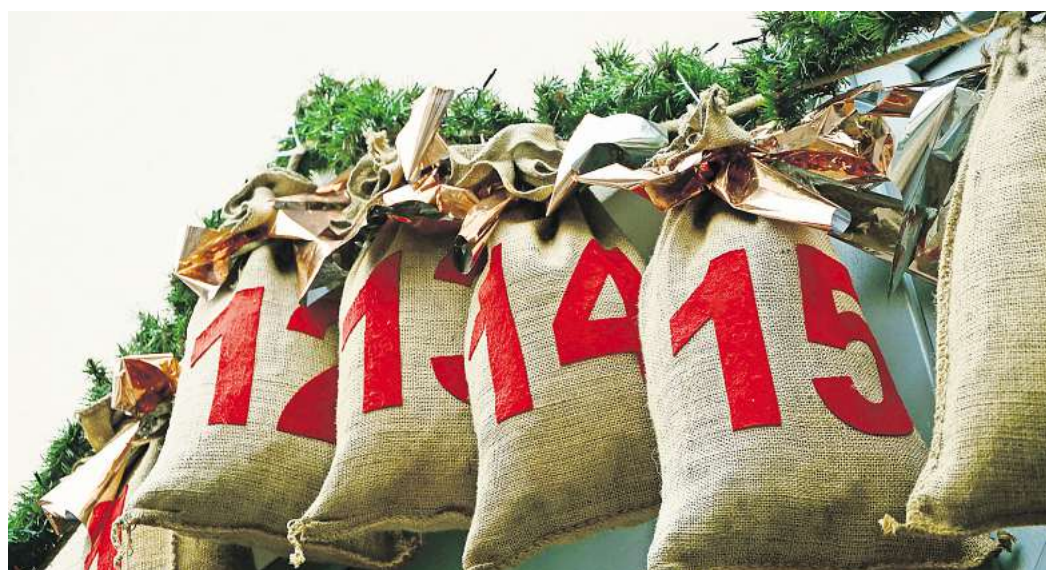
Ein Adventskalender ist nicht nur bei Kinder beliebt.

Das Mitmachen ist denkbar einfach: Vom 1. Dezember an kann unter www.waz-online.de/kalender jeden Tag ein digitales WAZ-Adventskalender-Türchen geöffnet werden, hinter dem sich jeweils eine WeCard verbirgt. Um die Spannung zu erhöhen, wechselt der Wert täglich. Gut gebrauchen kann diesen Wolfsburger Stadtgutschein aber definitiv jeder, sei es für sich selbst oder auch zum Weiterverschicken. Die WeCard ist bei zahlreichen Händlern, Gastronomen und Dienstleistern in Wolfsburg einlösbar und hilft ganz nebenbei dabei, die Attraktivität der Einkaufsstadt zu för-