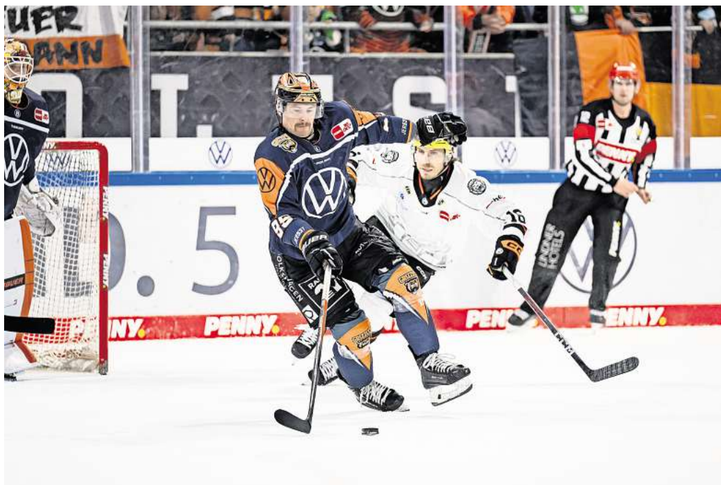
Für das Spiel der Grizzlys Wolfsburg gegen die Löwen Frankfurt können Leser wieder Tickets gewinnen.

Direkt zur Verlosung: Einfach den QR-Code mit dem Handy scannen.