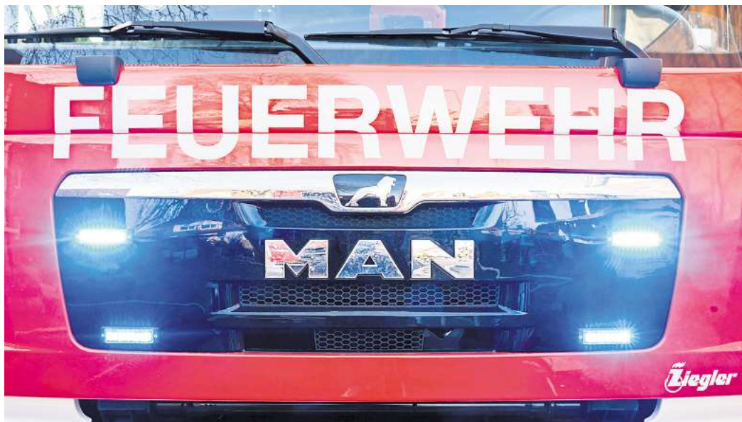
Die Stadt Wolfsburg plant die Entwicklung eines neuen Feuerwehrstandortes in Heiligendorf.

„Die Wahl des Standortes berücksichtigt sowohl die Wünsche des Orsrates als auch die Ergebnisse der Alternativprüfungen. Zudem fügt sich das Vorhaben in das Strukturkonzept Siedlungsflächen Wolfsburg ein, das die Möglichkeit einer baulichen Entwicklung in diesem Bereich vorsieht“, erklärt Stadtbaurat Kai-Uwe Hirschheide. Das Bebauungsplanverfahren wird als Vollverfahren durchgeführt und beinhaltet eine gesetzlich vorgeschriebene Umweltprüfung so-