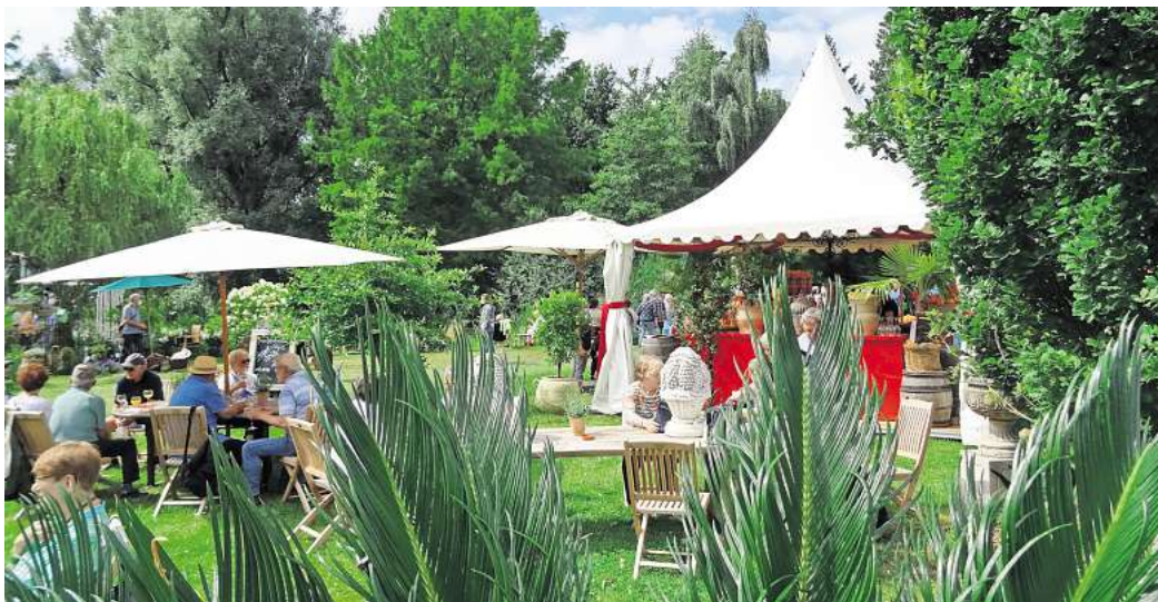
Es gibt viel zu sehen: Die WAZ verlost Freikarten für Blumen & Ambiente in Wienhausen.

Neben liebevoll gestalteten Gartenwelten gibt es auch etwas für den Magen: Ob leichte Blütensalate, Fisch- und Käsespezialitäten, Überseeweine, Kaffee und Kuchen oder frische Fruchtcocktails – da kommt jeder auf seine Kosten. Die WAZ verlost jetzt für das Gartenfestival 10x2 Karten.