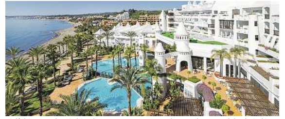
Vielzijdige Hotels, wie hier das 4,5* H10 Estepona Palace an der Costa del Sol, sind in allen Destinationen buchbar.

Nicht nur Spanien steht im Flugplan für den Herbst. Auch die griechischen Inseln Santorin und Zakynthos, Italiens Südspitze Kalabrien sowie Zypern und Madeira werden ab Braunschweig direkt angesteuert. Alle Urlaubsziele sind so gewählt, dass man mit besten Temperaturen rechnen kann und eine Mischung aus Baden, Erleben und vielfältigen Urlaubsmöglichkeiten kombiniert. Überall hat man die Auswahl aus einem großen Hotelfportfolio, Verpflegungsleistungen von Frühstück bis All-Inclusive, vielfältige Zimmerkategorien und auf Wunsch zubuchbare Erlebnisse