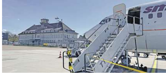
Ab Braunschweig direkt in die Sonne: Exklusiv bei momento by DER SCHMIDT

Den Katalog, weitere Informationen und Buchungsmöglichkeit dieser exklusiven Angebote im FIRST Reisebüro Schmidt und weiteren Reisebüros in der Region, unter der kostenfreien Buchungshotline T. 08 00 / 38 300 38 (Mo-Fr. 9-18, Sa. 9-13 Uhr) oder unter www.fliegen-ab-braunschweig.de .