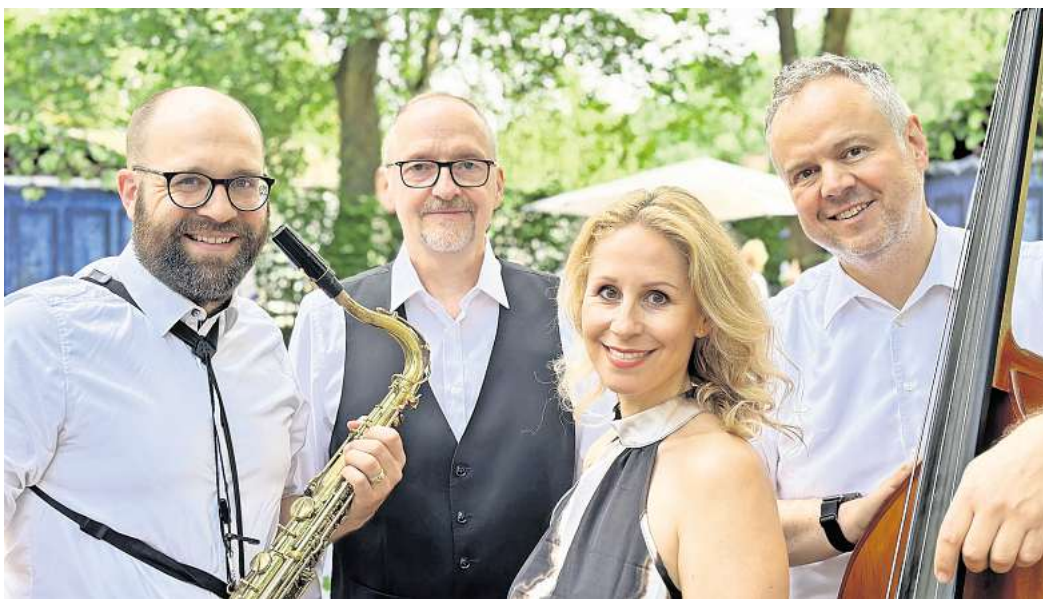
Die Ellingtones freuen sich schon auf ihren Auftritt in der Wolfsburger Innenstadt.

Die Jazzband Ellingtones aus Hannover und Hamburg hat sich nicht nur der Musiklegende Duke Ellington und den Klassikern aus Jazz und Swing verschrieben, sondern verwandelt auch große Hits aus Pop und Rock auf originelle Weise. Mit ihrem besonderen Mix aus populärer Jazzmusik und verjazzter Popmusik sorgen die Ellingtones seit über 20 Jahren für erstklassige musikalische Unterhaltung. Ihr breites Repertoire, die stilistische Vielfalt und flexible Besetzungsmöglichkeiten