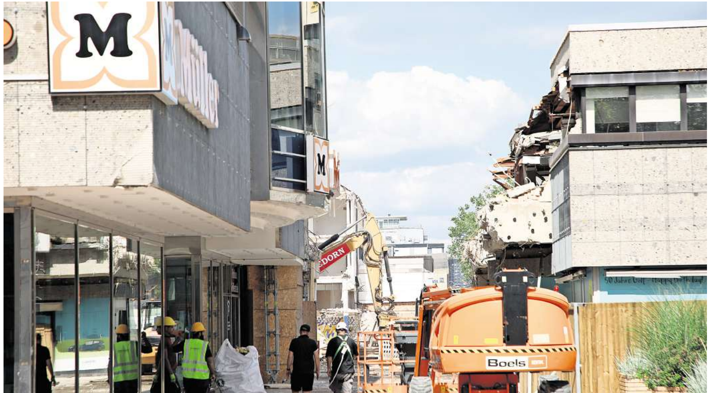
Da klafft die Lücke: Die Verbindung zwischen dem Pavillon und dem Geschäftsgebäude ist komplett abgerissen.

„Der Rückbau erfolgt unter beengten innerstädtischen Bedingungen mit einem Kettenhydraulikbagger und einer Abbruchzange“, teilt die Volksbank Brawo dazu mit. Durch diese Methode sei es möglich, „Beton kontrolliert zu brechen und gleichzeitig die Bewehrung zu durchtrennen und zwar vibrations- und erschütterungsarm.“ Dadurch eigne sich das Verfahren besonders laut Volksbank „für sensible Innenstadtlagen.“ Die angefallenen Gebäudereste wurden anschließend direkt noch auf der Baustel-