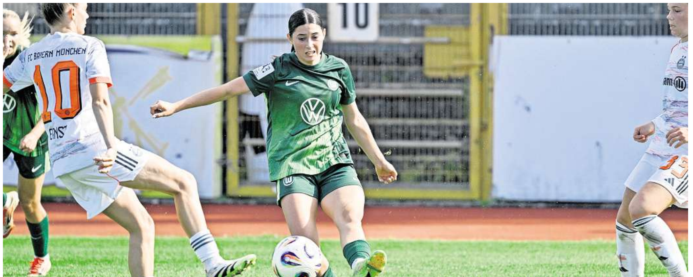
Der VfL Wolfsburg will weitere Punkte sammeln

Direkt zur Verlosung: Einfach den QR-Code mit dem Handy scannen.