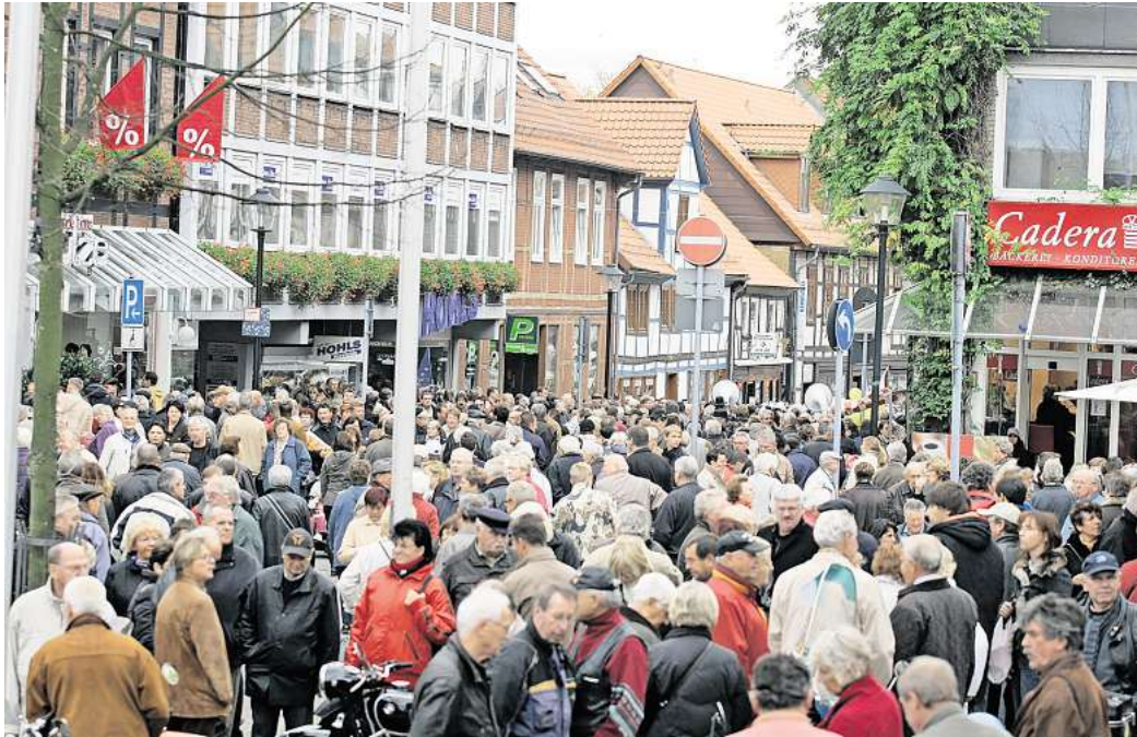
Für den verkaufsoffenen Sonntag in Vorsfelde werden Straßen gesperrt. (Archivbild)

Die Einschränkungen wirken sich auch auf den öffentlichen Nahverkehr aus. Die Haltestellen „Ütschenpaul“, „Ernst-August-Straße“, „Petruskir-