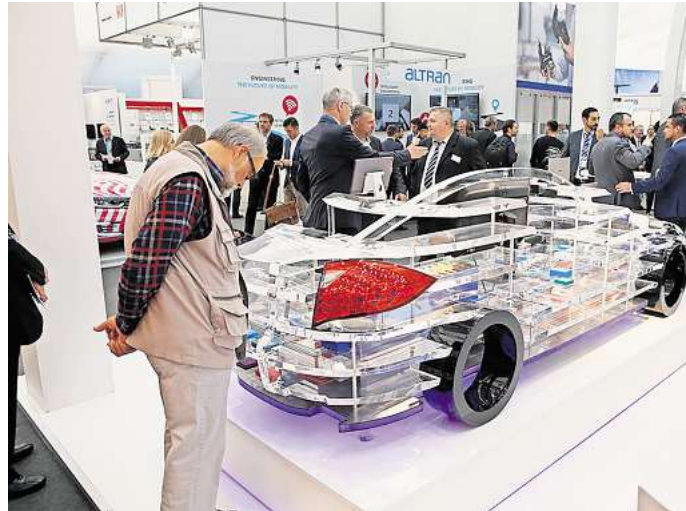
Die Zulieferermesse IZB in Wolfsburg setzt auf die Trendthemen der Automobilbranche.