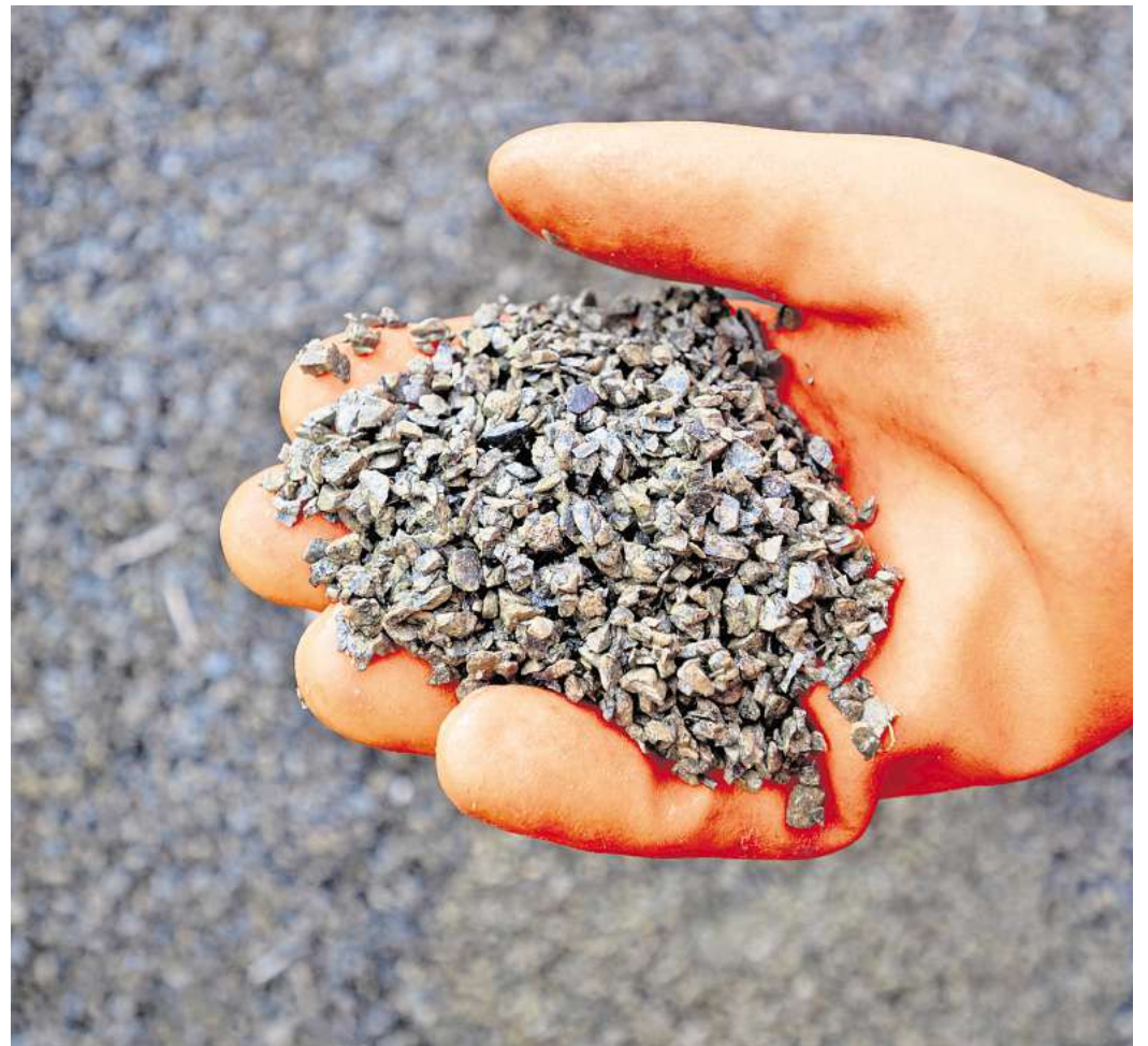
Granulat ist nur eine Option: Die Auswahl an Streumitteln ist groß, wenn man glatte Gehwege streuen will.