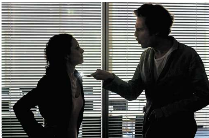
Guter Indikator: Agiert die Führungsebene toxisch, sind in der Regel mehrere Mitarbeitende betroffen.

Bestehende toxische Strukturen zu verändern, ist aber nicht immer einfach oder gar realistisch. In einem solchen Fall bleibt oft nur ein Jobwechsel als Ausweg. (DPA)