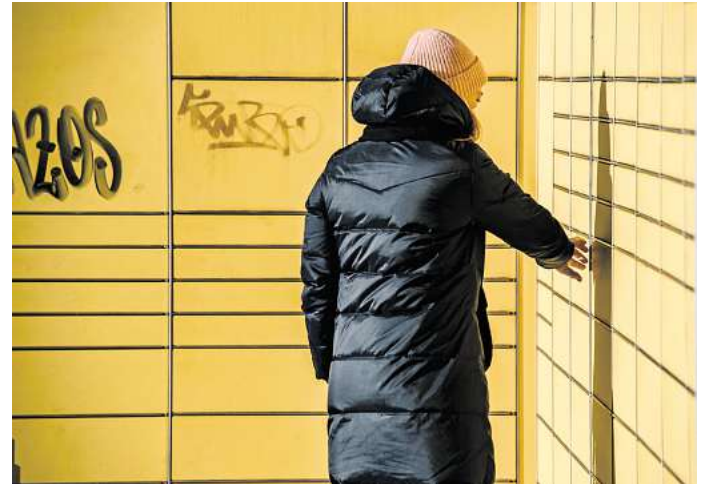
Sie haben als Ablageort die Packstation gewählt? Sobald das Paket dort als eingelegt vermerkt ist, tragen Sie selbst das Risiko für Schäden oder Verlust.

Auf Nummer sicher gehen Empfängerinnen und Empfänger „c't“ zufolge dann, wenn sie die Lieferung in einen Paketshop umleiten lassen oder den Liefertermin auf einen Tag verschieben, an dem sie selbst zur Annahme zu Hause sind. Diese Möglichkeiten seien besonders sicher, weil erst mit der persönlichen Annahme der Gefahrenübergang erfolge. (DPA)