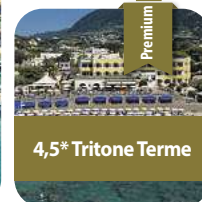
4,5* Tritone Terme

Barcelona 29.03. – 02.04.2026 5 Tage pro Person im Standard Glückshotel ab € 499,- Premium Glückshotel ab € 599,- EZ-Zuschlag € 140,- | HP € 100,-