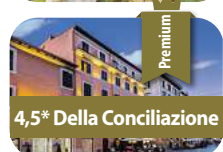
4,5* Della Conciliazione