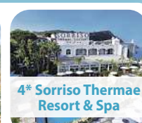
4* Sorriso Thermae Resort & Spa

8 Tage pro Person ab € 799,- 07.04. – 14.04.2026 14.04. – 21.04.2026 (+ € 25,-) RESTPLÄTZE! AUSGEBUCHT!