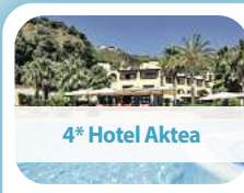
4* Hotel Aktea