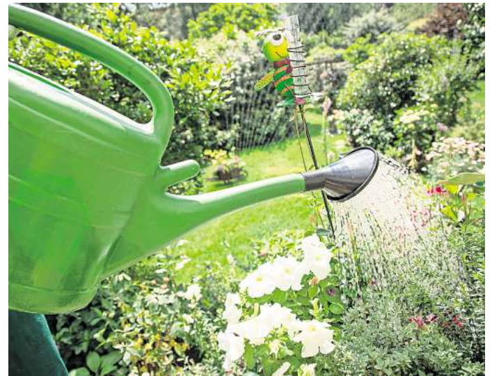
Feste Gießzeiten und eine kleine Runde durchs Grün - so bleibt man dran.

Nur wer seinen Garten regelmäßig beobachtet, lernt ihn besser kennen und erkennt sofort, wenn es ein Problem gibt. Es kann helfen, feste Abläufe einzuplanen - etwa regelmäßige Gießzeiten, die man mit einem kurzen Kontrollgang verbindet, so Lutz Popp. Dabei sieht man auch gleich, was sich im Garten getan hat. Das motiviert zusätzlich. (DPA)