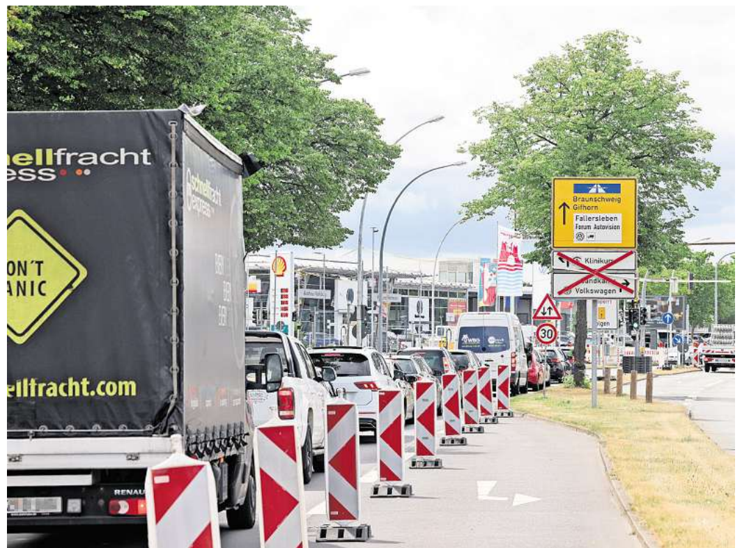
Bereits im vergangenen Sommer wurde ein Abschnitt der Heinrich-Nordhoff-Straße während der Ferien saniert.

Aus der Ratsvorlage zur Deckensanierung geht aber zumindest hervor, dass sowohl die Lessingstraße als auch der Schachtweg in dieser Zeit von Osten kommend nicht angefahren werden können. Der Verkehr soll über die Saarstraße umgeleitet werden.