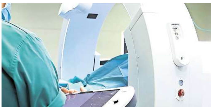
Loop-X und die Curve-Navigation ermöglichen besonders schonende und sichere Operationsverfahren.

Mit der neuen Technologie will das Klinikum Wolfsburg seinen Anspruch unterstreichen, medizinische Leistungen auf Spitzenniveau anzubieten – und den Wandel im Gesundheitswesen aktiv mitzugestalten.