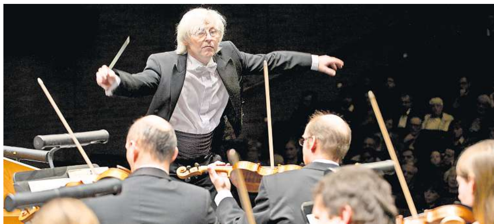
Kommt am 14. April für ein Konzert in die Wolfsburger Kreuzkirche: die Tschechische Kammerphilharmonie Prag.

Viele namhafte Komponisten haben sich den „Vier Jahreszeiten“ gewidmet, doch die erfolgreichste musikalische Umsetzung dürfte die von Antonio Vivaldi sein. In seinen weltweit bekannten „Die Vier Jahreszeiten“ hat der Komponist, selbst ein meisterhafter Geiger, sein Violinkonzerte miteinander verbunden: Jedes Konzert beschreibt eine Jahreszeit. Vor allem werden Naturerscheinungen