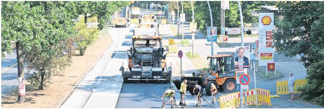
Braunschweiger Straße: Nach der Sanierung zwischen Burgwall und Am Rotheberg im Vorjahr wird in diesem Jahr der Asphalt zwischen Rabenbergstraße und Burgwall erneuert.

Die Sanierung soll in den Sommerferien in zwei Bauabschnitten vorbehaltlich des notwendigen Ratsbeschlusses erfolgen, wie die Stadt mitteilte. Es soll zwei Bauphasen von jeweils einhalb Wochen geben, in denen die Asphaltdecke erneuert, Bordsteine und Abflüsse gegebenenfalls repariert und Markierungen aufgebracht werden.