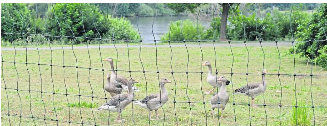
Hinter Gittern: Die Graugänse am Schillerteich. Der Zaun soll verhindern, dass sie den Berliner Ring überqueren.