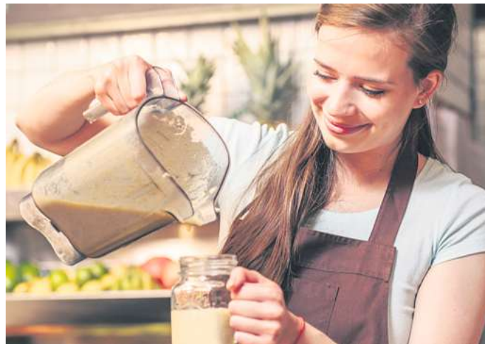
Die Sommerferien beginnen bald und damit für viele Schülerinnen und Schüler auch die Zeit eines Ferienjobs.

(KindArbSchV) ergänzt wird. In landwirtschaftlichen Familienbetrieben beträgt die zeitliche Obergrenze für die Arbeit drei Stunden pro Tag. Ab 15 Jahren dürfen Jugendliche 20 Tage im Jahr jobben. Diese können sie auf das Jahr verteilen oder vier Wochen am Stück arbeiten, etwa in den Sommerferien. „Schüler dürfen dann sogar an Werktagen bis zu acht Stunden pro Tag zwischen 6 und 20 Uhr einer beruflichen Tätigkeit nachgehen“, so Müller. Ausnahmen gibt es etwa in der Gastronomie, in der Altenpflege oder der Landwirtschaft: Hier ist auch eine Wochenendarbeit erlaubt. Über 16-Jährige, die bei einem Bäcker arbeiten möchten, dürfen bereits ab 4 Uhr mit der Arbeit beginnen. In der Gastronomie oder im Veranstaltungsbereich ist aber spätestens um 22 Uhr Schluss. Mit der Volljährigkeit gilt das Jugendarbeitsschutzgesetz nicht länger und Jugendliche können die gleichen Arbeiten verrichten wie jeder Erwachsene auch. Das heißt: Ein Ferienjob kann dann sogar 50 Tage lang sein. Übrigens: „Arbeitgeber müssen