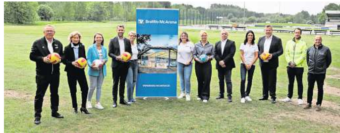
Auf dem Gelände des SSV Vorsfelde wird ab Juni die neue Freilufthalle, die McArena, gebaut.